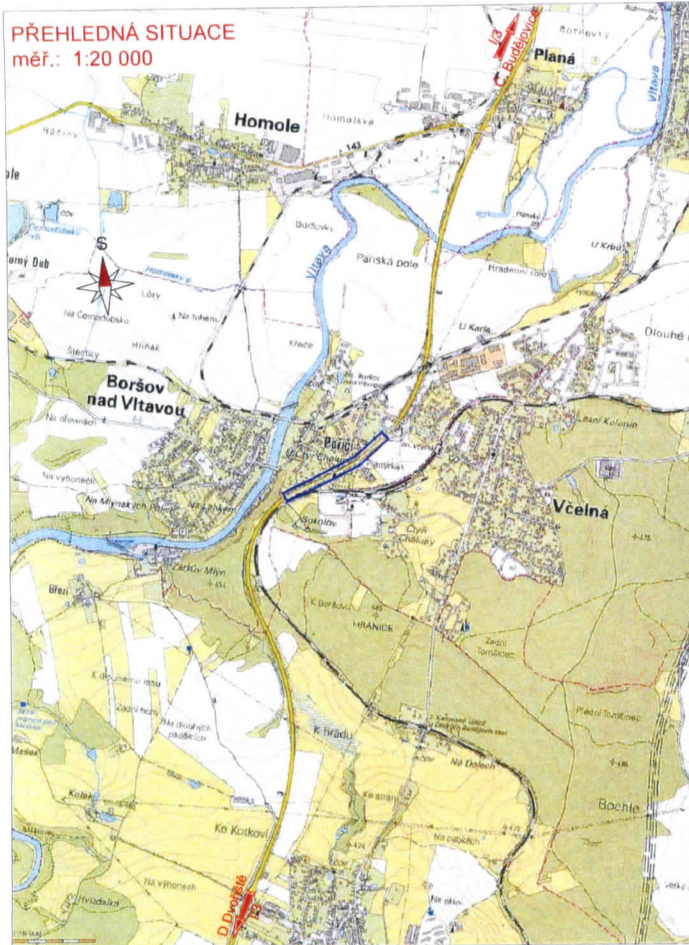
PŘEHLEDNÁ SITUACE měř.: 1:20 000